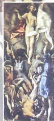
Fragmento Pintura "Resurrección del Señor" El Greco 1541/1542-1614.