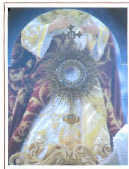
¡Muéstranos a Jesús, el Fruto Bendito de Tu vientre!

Como en las bodas de Caná. María intercede por nosotros, pero nos dice como a los criados: "Haced lo que El os diga". A nosotros nos corresponde "llenar las tinajas hasta arriba".